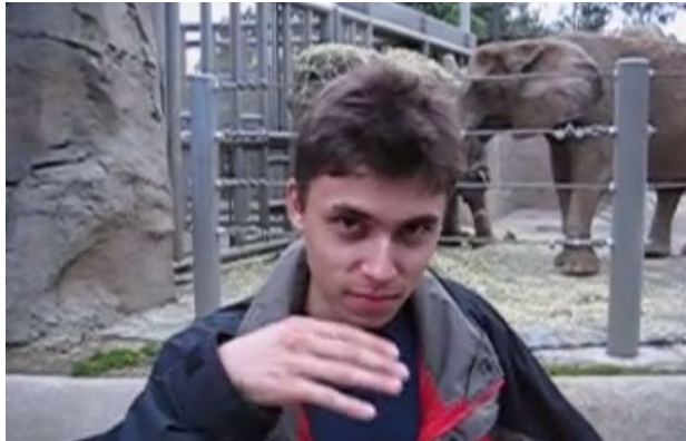
Me at the zoo 2005年4月24日上傳 https://youtu.be/jNQXAC9IVRw

國際知名影音平台《YouTube》2005年2月14日創立至今已經16年，而YouTube成立後也大大改變了人們使用影音的方式。YouTube創辦人卡林姆（Jawed Karim）也在YouTube上傳第一支自拍影片《我在動物園》(Me at the zoo)引發關注，這支影片雖然只有短短18秒卻改變了全球網友對傳媒的使用方式。